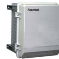
Oberteil Kunststoff Unterteil Aluminiumdruckguss