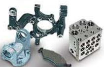
METALLRINGE, FLANSCHEN, BREMSBELÄGE UND JEDES ANDERE HANDLING