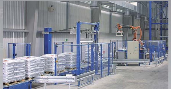
z. B. schlüsselfertige Sackabfüllanlage mit Abfüllung und Palettierung von über 1.000 Säcken pro Stunde

z. B. Karton-/Displaykarton-Palettierung von bis zu 3.600 Gebinden pro Stunde