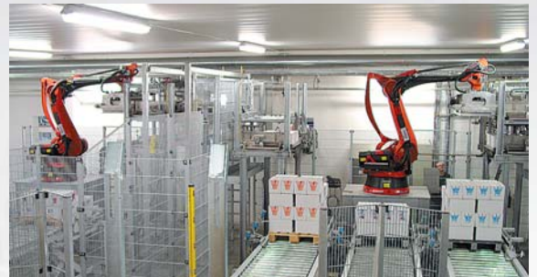
z. B. vollautomatisches Palettierzentrum für Milchtrays mit Anbindung der 2 redundanten Leitrechner an das übergeordnete SAP-R/3-System des Kunden