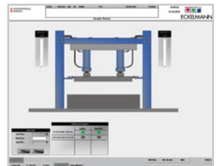
VISUALISIERUNG EINER STANZE

Für alle Produkte gewährleistet ECKELMANN eine kontinuierliche Produktfolge sowie ein nachhaltiges Servicekonzept auf Basis langer, garantierter Verfügbarkeit von Ersatzteilen .