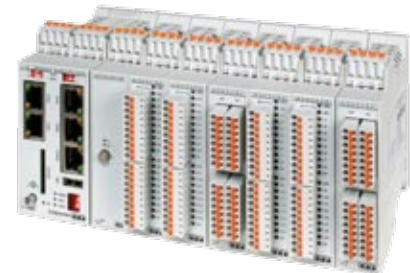
E•HyCON MIT I/O MODULEN

Die Localbusmodule der LBM-Serie bieten eine bedarfsgerechte Auswahl an digitalen und analogen Ein- und Ausgangsmodulen . Die Localbusmodule werden modular an den Controller angereicht.