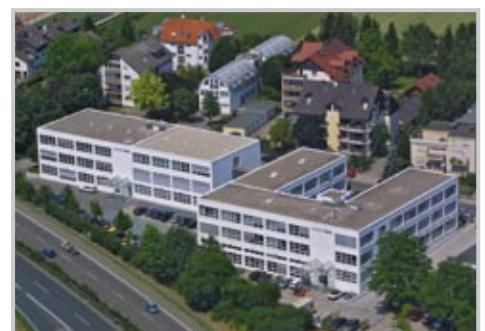
ECKELMANN AG, Wiesbaden