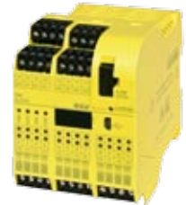
FBM SLC 204 SAFETY MODUL