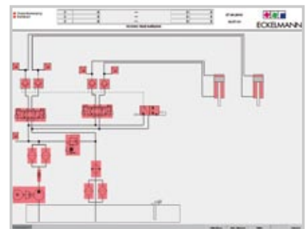
VISUALISIERUNG IN E•VIS BEISPIEL HYDRAULIKPLAN