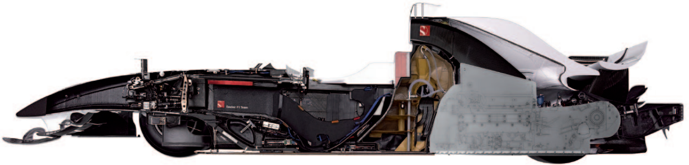
Sauber F1 Team cutaway race car